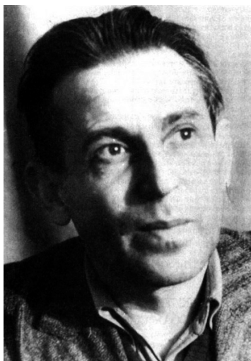
Рис. 4. Варпаховский Леонид Викторович (1908–1976), режиссер. Фото из журнала «Словесница искусств». 2012. № 2 (30). С. 48